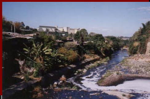
San Luis Portales

La recuperación de las marginales, debía continuar, pues ello cambia la calidad de vida de sus habitantes y de la ciudad.